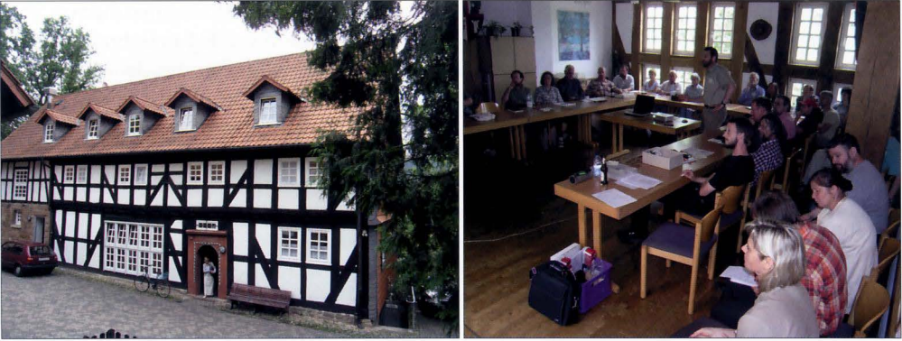
Abb. 2–3: Das CVJM-Heim „Hof Largesberg“ präsentierte sich als idealer Veranstaltungsort für die Jahrestagung der Dipterologen Deutschlands; – 2: Vorderansicht vom Hof Largesberg; – 3: Während der Vortragsveranstaltung am Freitagnachmittag.

sche Anzeigen“. In diesem Zusammenhang wurden die Anwesenden auch dazu aufgerufen, ergänzende Bildmaterialien (Porträts) einzuschicken und Artnachweise von den zurückliegenden Tagungsexkursionen (Artenlisten) bereitzustellen.