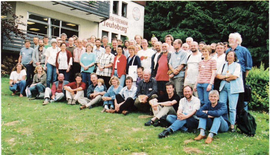
Die Teilnehmer an der 21. Tagung des AK Diptera vor dem „Naturfreunde“-Haus in Ubbedissen.